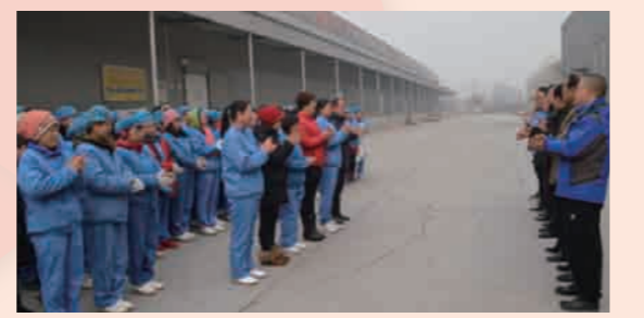
通讯员 百枣纲目 林清

职工们表示，感谢工会和百枣纲目领导的关心，今后一定会怀着一颗感恩的心加倍努力地干好本职工作，以实际行动回报社会、感恩企业。新的一年，心往一处想，劲往一处使，拧成一股绳，撸起袖子继续加油干，为公司创造出新的辉煌。 活动最后，公司领导将补助金亲手交到困难职工手中，相继传达了公司对各位的美好祝愿和新年祝福。